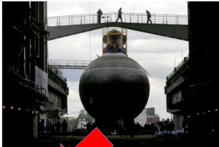
Een Russische duikboot wordt vervoerd op een scheepswerf in Sint-Petersburg.

In november is een Russische duikboot door Belgische wateren gevaren. Dat verklaarde Kapitein... Gillis, directeur beleidsondersteuning bij de marine, in Knack. 'We zullen ermee moeten leren leven dat oorlogsschepen weer langs onze kust passeren.'